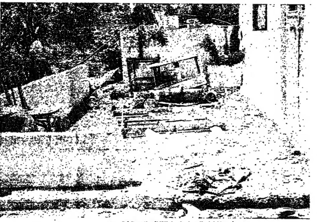
أحد المنازل التي أصابها القصف الإسرائيلي

واقبال : ومصرف ان أهالي البلدة يتعمدون في معيشتهم على بعض الخضروات والمراشي ، وقد احترقت المراش ، ونقلت معظم المراشي . وإذا لم يسفر الدولة الى مساعدتنا في صنواجه في الشهور القليلة المقبلة فمهما سينا للقلية ، والبقية على الصفحة ٥ .